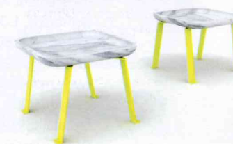
Sopra, un dettaglio della collezione Isola . Sotto, tavolo e panca della linea Nativo , aziende De Castelli e Nerosicilia .

si trova al "confine", appunto, tra elemento funzionale e complemento d'arredo. Il suo design si sviluppa in maniera tale da raggiungere la fusione perfetta tra i due elementi. Le superfici sono rivestite e reinterpretate dal mosaico. Con la loro texture che ricorda quella di un tessuto, i modelli Agape e Affinità sono ispirate ai momenti di relax personale e di convivialità, atmosfere mutate dal più classico concetto di camino. Nel caso del modello Falò , il mosaico arriva a tradurre graficamente il senso della cenere.